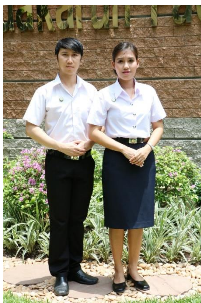
ชุดเครื่องแบบนักศึกษาปกติ