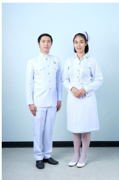
ชุดเครื่องแบบวันสำเร็จการศึกษา