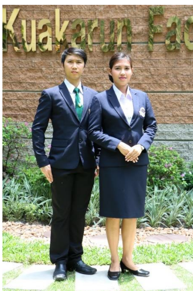
ชุดเครื่องแบบนักศึกษาพิธีการ